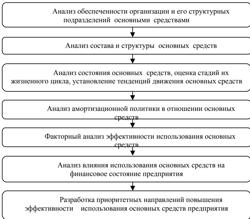
Рисунок 1 Алгоритм анализа эффективности использования основных фондов

услуги и выполняются работы. Основные фонды занимают основной удельный вес в общей сумме основного капитала хозяйствующего субъекта. От их количества, стоимости, качественного состояния, эффективности использования во многом зависят конечные результаты деятельности хозяйствующего субъекта [3].