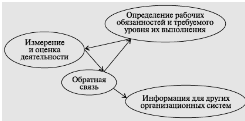
Рис. 1.1. Цикл оценки деятельности работников

Показатели деятельности руководителей подразделений приведены в табл. 1